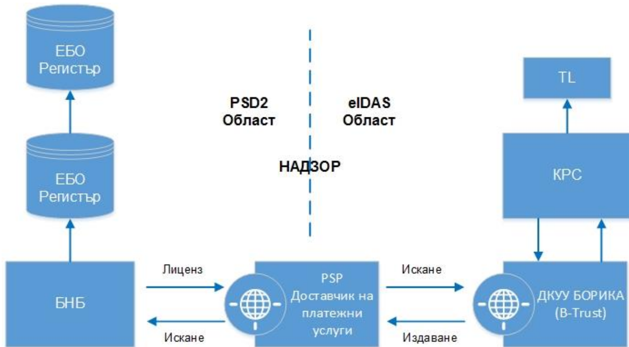
Фиг. 2. PKI участници в услугите на PSD2 – надзор (регулация)

Фиг. 2 представя релациите спрямо Надзора към участниците в PKI по тази Политика от позицията на PSP (платежна институция).